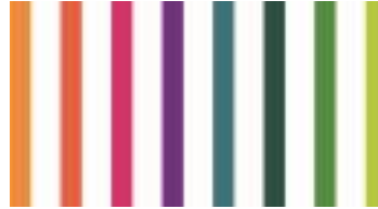
Figura 2 - Differenze nei sistemi di monitoraggio, performance e valutazione tra l'attuale programmazione la futura PAC